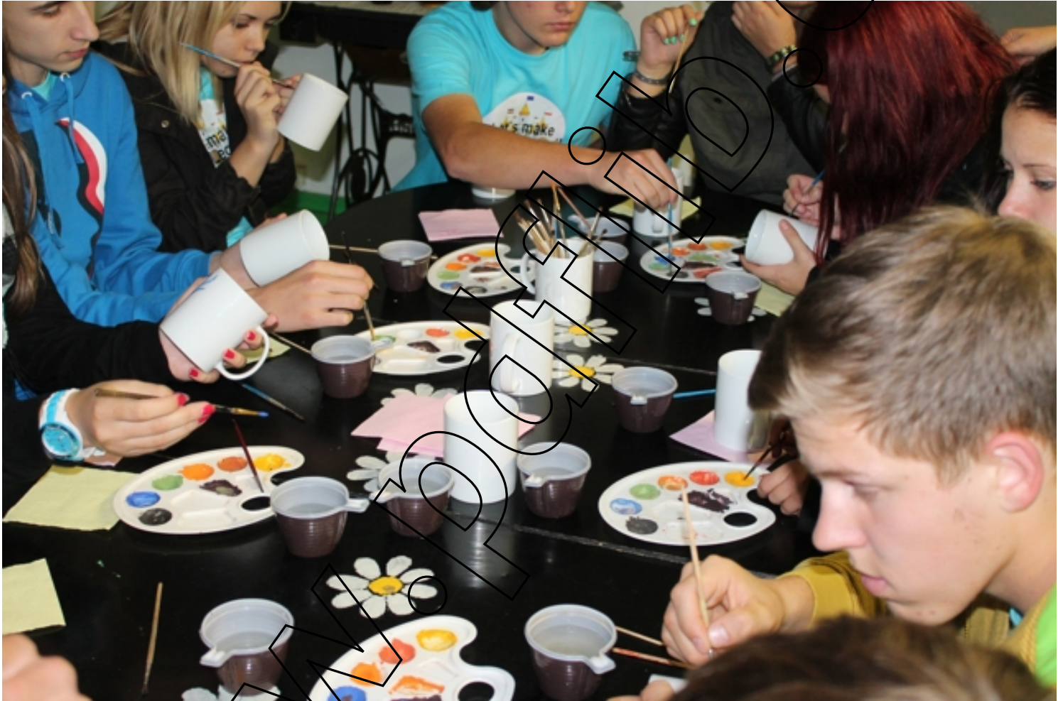
Warsztaty ceramiczne w fabryce porcelany Vecpiebalgas.

Jego zadaniem jest rozwijanie kreatywności uczniów poprzez uczestnictwo w projekcie z innymi młodymi ludźmi z otwo. Odbędzie się warsztaty: teatralny, fotograficzny, ceramiczny. W efekcie końcowym projektu powstanie przedstawienie teatralne na temat wybranej wspólnej historii Polski oraz otwo.